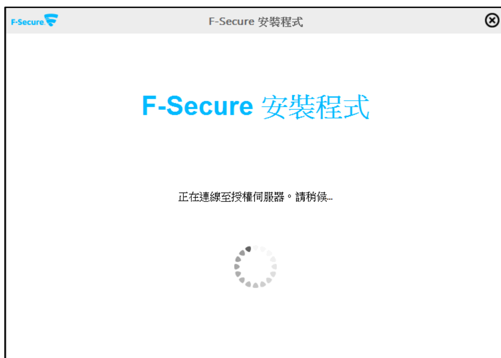
▲ 進行安裝程式畫面