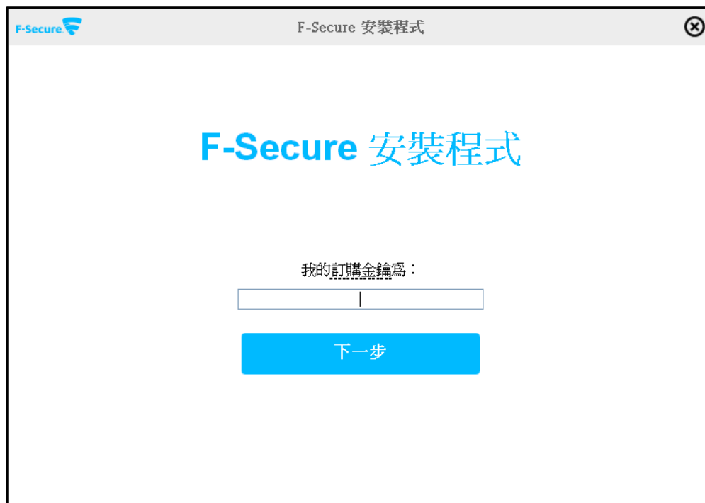
▲ 啟用產品授權畫面