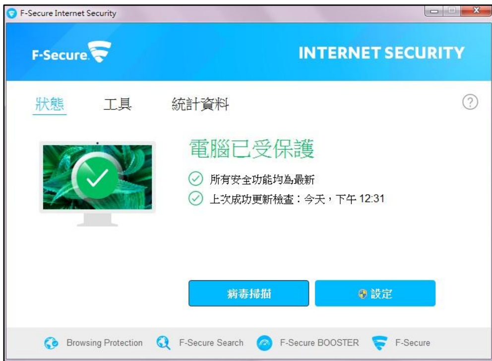
▲ 安裝完成畫面：電腦已受防護