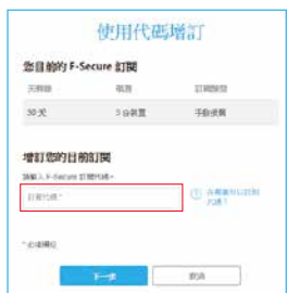
▲產品授權啟動程序2