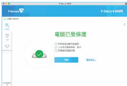
▲程式安裝完成畫面

安裝完成後，請先執行檢查更新的操作(需連接網際網路)，第一次更新時間會稍久，更新完成後不僅能掃描更多潛在威脅，也能讓偵測更為準確。