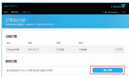
▲產品授權啟動程序1