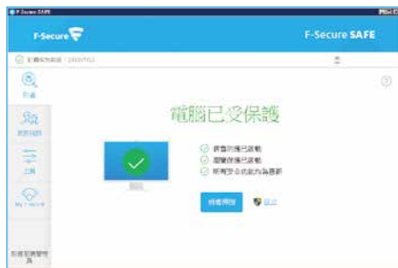
▲程式安裝完成畫面

安裝完成後，請先執行檢查更新的操作(需連接網際網路)，第一次更新時間會稍久，更新完成後不僅能掃描更多潛在威脅，也能讓偵測更為準確。