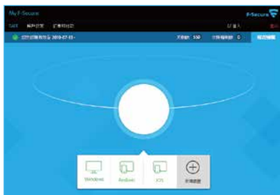
▲【我的芬-安全帳號】顯示所有裝置畫面