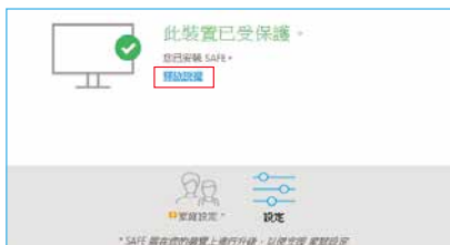
▲裝置釋放授權畫面