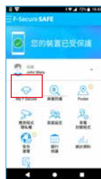
▲程式安裝完成畫面

請點選行動裝置主介面【病毒掃描】，為您的行動裝置做整體的防護檢驗，確認行動裝置內無其他惡意app程式。